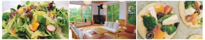
お野菜たっぷりサラダ 緑っぱいのホール 絶品!! フォカッチャ