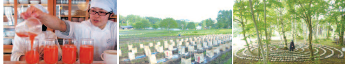
無農薬人参ジュース 作物の養生 あんどん タマヌール 石の螺旋

2日目 7:00～自然農園散策 7:30～朝食 9:00～講義・Q & A 12:00～感想文記入 12:30～昼食 (希望者のみ) 13:30～乗合タクシー発