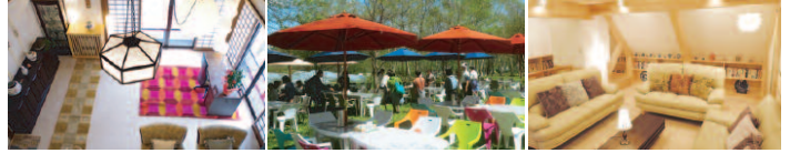
しゅり庵のリビング 白樺林の中のランチ ゆっくりとくつろげる